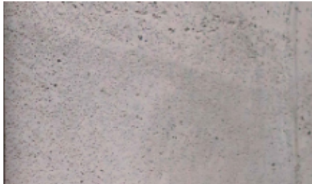
Wand aus Infralichtbeton

Durch die einschalige Konstruktion entfallen Arbeitsschritte für zusätzliche Dämmschichten, Anschlüsse werden einfacher, Bauteile werden robuster und recyclingfähig. Allerdings muss die Hydratationswärme, die wegen der guten Dämmeigenschaften schlecht abfließen kann, durch geeignete Maßnahmen reduziert werden. Die geringe Frischbetonrohichte des Infralichtbetons (die Zuschläge sind leichter als das Wasser) erfordert ein durchdachtes Verdichtungskonzept. Außenbauteile aus wärmedämmendem Leichtbeton sind aufgrund ihrer geringen Dichte und porigen Struktur empfindlich gegen eindringende Feuchtigkeit. Die großen Schwind- und Kriechverformungen und der geringe Elastizitätsmodul müssen planerisch berücksichtigt werden.