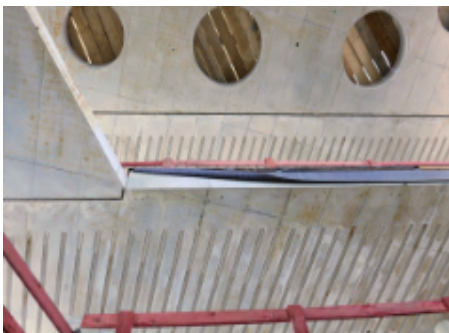
Stahlbetondecke mit Akustikelementen

Bereits die Römer verwendeten das opus caementitium, woraus sich unser Wort Zement herleitet. Beton besteht aus Kies, Sand und Zement als Bindemittel. Durch die Zugabe von Wasser wird der chemische Abbindevorgang eingeleitet. Zur Steuerung der Eigenschaften des Betons können bestimmte Zusatzstoffe und -mittel beigemischt werden. Beton lässt sich in nahezu beliebige Formen gießen, ermöglicht ein breites Gestaltungsspektrum und kann beinahe überall verbaut werden. Bedauerlicherweise gilt die notwendige Zementproduktion mit ihrem hohen CO 2 -Ausstoß als einer der Hauptverursacher der Klimaveränderungen.